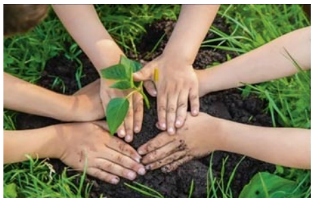
10 jaar zadenbib

Kardinaal Mercierplein 6 www.jette.bibliotheek.be Facebook: @BibJette 02.427.76.07