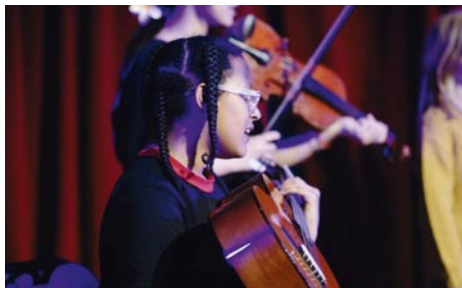
Samenspel op jaarlijkse verhalenfeest

Wilgstraat 1 www.jetseacademie.be 02.426.72.94