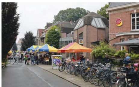
Feest in 't straat - © Renaud Ben Lakhal

Leopold I-sstraat 329 Facebook @Essegem www.essegem.be Info & reservaties: 02.427.80.39 – essegem@vgc.be tickets.vgc.be/essegem