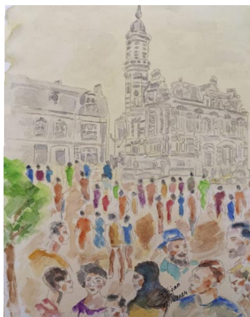
3 e prix : Ghalamkaripour Bijan "Jette anno 1930"