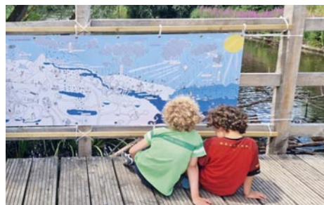
La Magie de l'eau