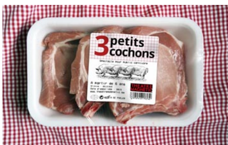
Spectacles de printemps