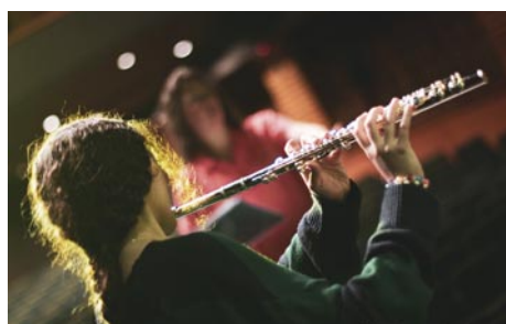
Académie (pluridisciplinaire)

Rue du Saule, 1 secretariat@academie-jette.be www.academie-jette.be 0490.52.27.51