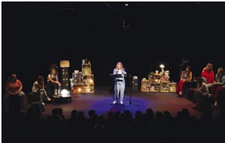
Les Confidentielles © Catherine Renard

Rue G. Van Huynegem 30-32 Inscriptions lerayonvert@skynet.be www.lerayonvert.be 0498.63.75.97