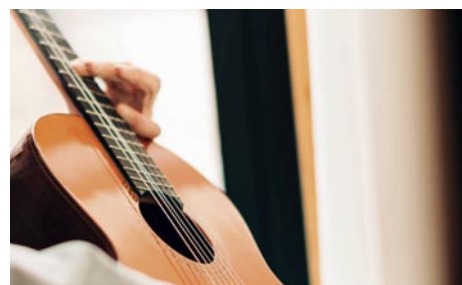
Guitara Con Compañeros

Bd de Smet de Naeyer, 145 Facebook @centrecultureldejette www.ccjette.be 02.426.64.39